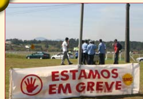
Começa a greve 01/09 - Metalúrgicos da Volks, Renault e Volvo rejeitam baixa proposta do Sinfavea e param em protesto por 24 horas