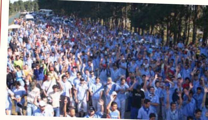
2006: Após uma semana de paralisação total, a categoria garantiu 5% de aumento salarial (2,89% do INPC + 2,11% de aumento real), e abono de R$ 700,00.

A mobilização e luta por melhores salários e condições de trabalho nas montadoras da Grande Curitiba é constante. Nos últimos anos, os metalúrgicos participam ativamente, junto com o Sindicato, de greves e paralisações visando uma maior valorização da categoria. E essa mobilização tem dado resultado. Confira: