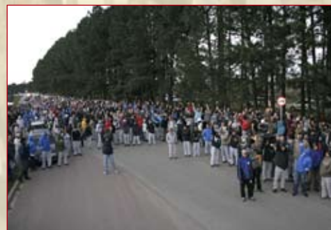
Nova proposta reprovada na Volks 08/09 - Volks propõe reajuste de 11% (3,66% de aumento real + 7,15% do INPC) para setembro e abono de R$ 1.450,00 para 22/09. Empresa quer descontar dias da greve até janeiro de 2009 (um dia por mês). Proposta é rejeitada pela maioria e greve continua.