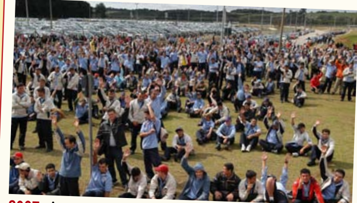
2007: Ano passado, os metalúrgicos da Volks-Audi e Renault fizeram greve de quatro dias. Como resultado, conquistaram 7,44% de aumento (4,82% do INPC + 2,5% de aumento real), além de um abono salarial de R$ 1,5 mil. Na Volvo, não houve paralisação.