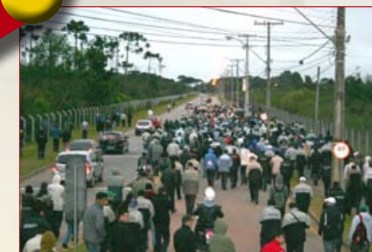
Fim da greve na Renault 09/09 - Metalúrgicos da Renault aceitam proposta de 10% de reajuste para setembro (2,66% de aumento real + 7,15% do INPC), além de abono de R$ 1,5 mil para 08/09 e outros R$ 100,00 para 19/09. Greve de 4 dias é encerrada. Dias parados serão descontados do banco de horas dos trabalhadores.