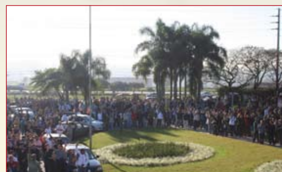
Ultimato 26/08 - Após três reuniões sem nenhuma proposta, SMC rompe negociações com Sinfavea. Em assembléia, trabalhadores dão ultimato até dia 29/08, para Volks, Renault e Volvo atenderem reivindicações