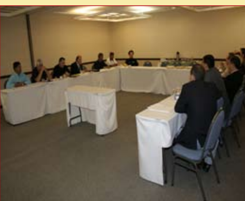
Sem proposta 18/08 - Em reunião, Sinfavea enrola e não apresenta nenhuma proposta salarial aos trabalhadores