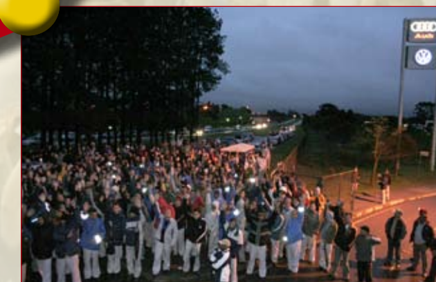
Fim da greve na Volks 09/09 - Acaba a greve na Volks. Metalúrgicos conquistam 11% de aumento para novembro, mais R$ 2 mil de abono para 15/09. Seis dias de greve serão descontados do adicional de horas extras dos trabalhadores.