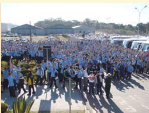
Pauta aprovada 13/07 - Assembléias na Volks, Renault / Nissan e Volvo aprovam pauta de reivindicações da categoria. Bandeiras de luta são encaminhadas às empresas