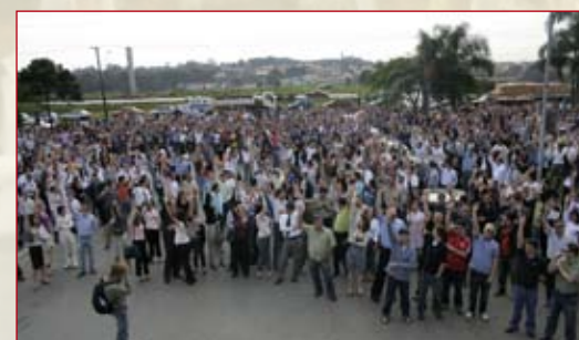
Volks e Renault em greve. Volvo fecha acordo 03/09 - Metalúrgicos da Volks e Renault rejeitam 10% de aumento (2,66% de aumento real e 100% do INPC para novembro -Volks e dezembro - Renault), e R$ 1,5 mil de abono para setembro. Greve continua. Na Volvo, proposta é aprovada, com aumento para setembro.