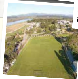
MetalClube de Campo São José dos Pinhais