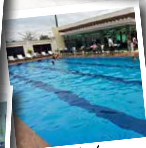
Centro de Lazer em Matinhos