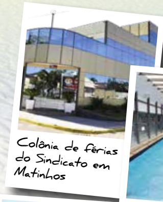
Colônia de Férias do Sindicato em Matinhos