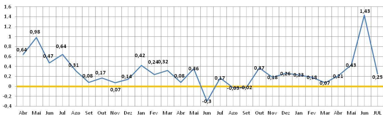
Variação mensal INPC 2015-2018 (%)

Fonte: IBGE, 2018. Elaboração: Subseção Dieese - FS