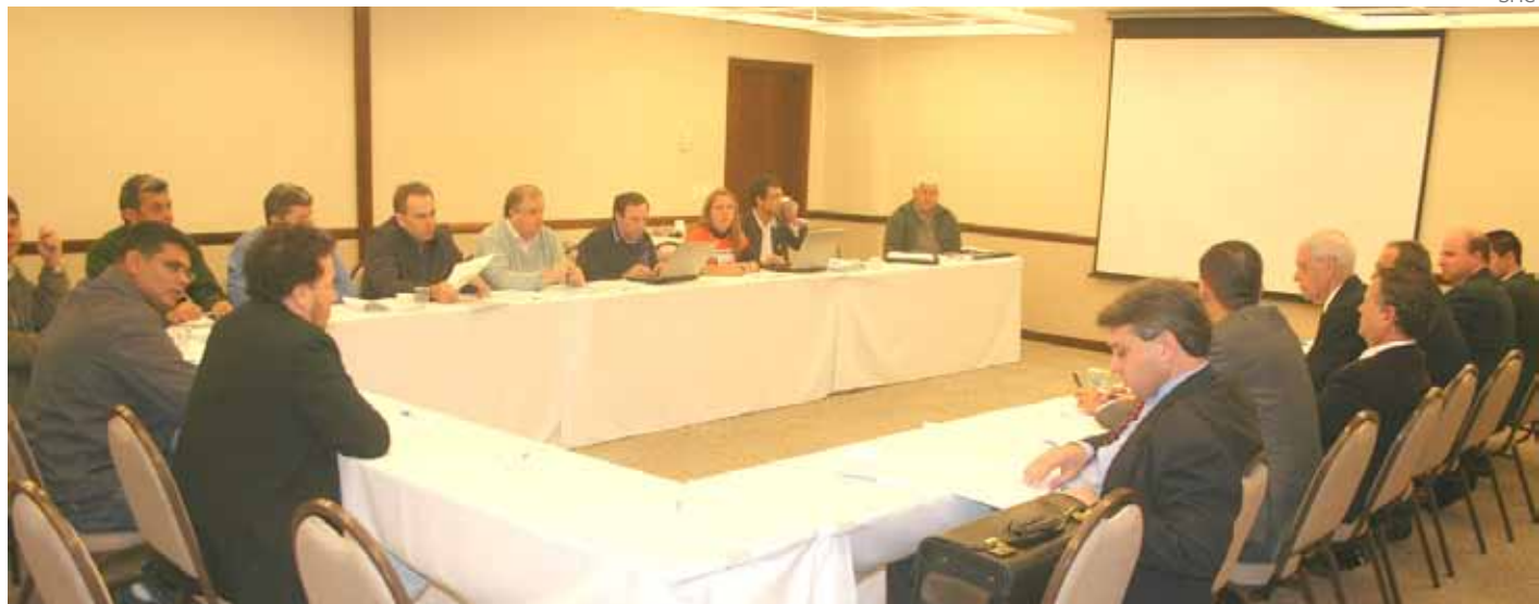
Cartão de visitas: logo na primeira reunião de negociação, Sinfavea só enrolou

PAUTA | Discussões estão sendo feitas individualmente, empresa por empresa