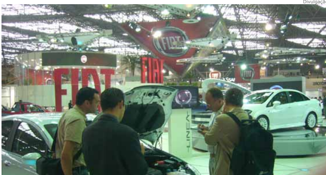
Em julho, 285,4 mil unidades foram comercializadas no País

Nos últimos 12 meses, o número de veículos comercializados