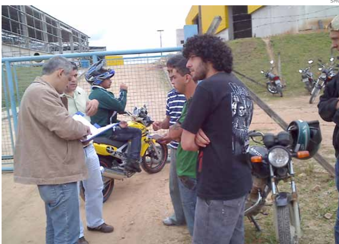
SMC, trabalhadores e oficial de justiça (primeiro à esquerda) durante a reintegração.

A arbitrariedade foi informada ao Sindicato, que logo entrou com uma liminar na Superintendência Regional do Trabalho e Emprego (SRTE), exigindo a reintegração dos cinco funcionários. Uma mesa redonda entre as duas partes foi realizada no dia 24 de julho e a empresa foi obrigada a reintegrar os trabalhadores.