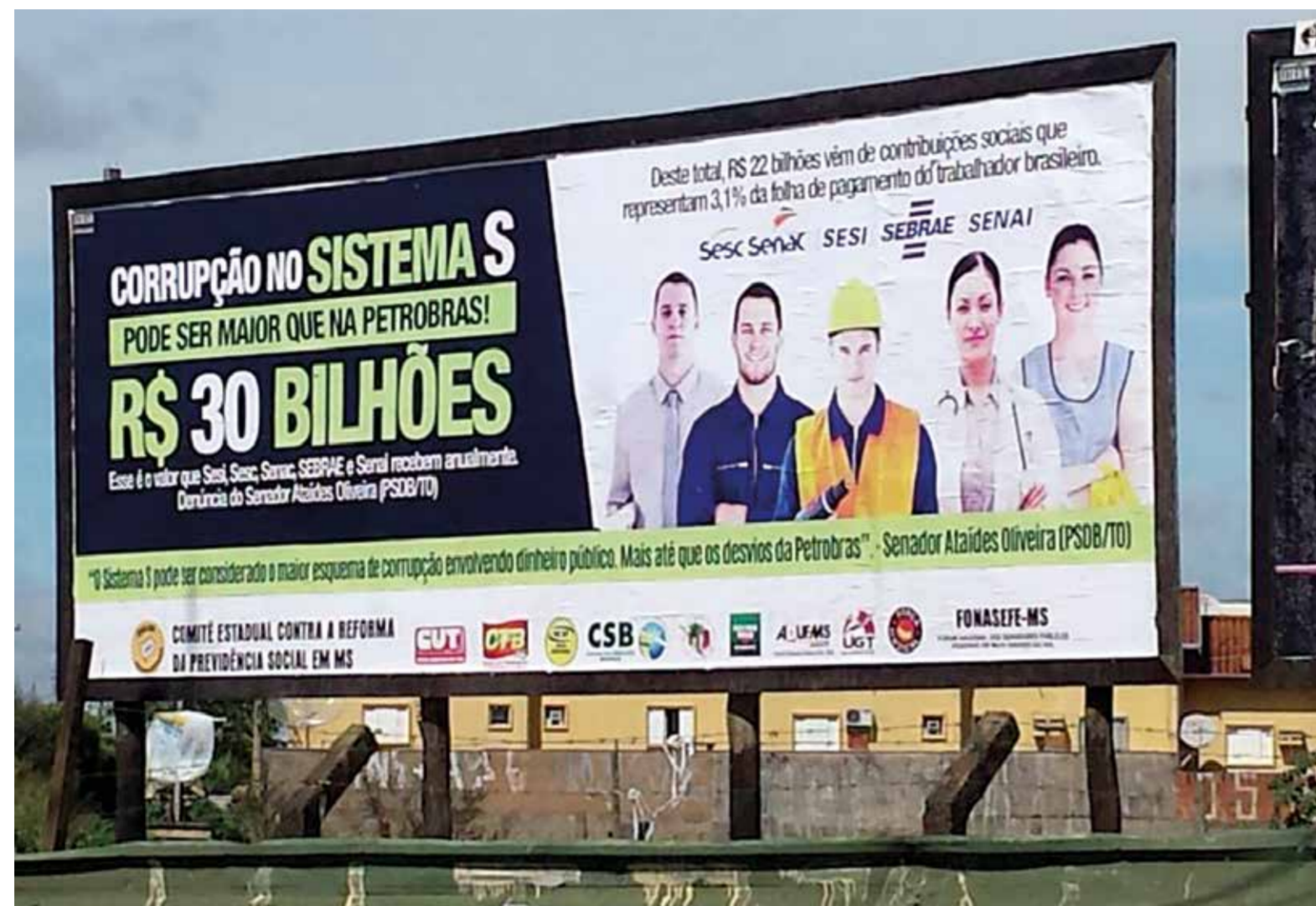
Centrais iniciam campanha para denunciar maracutaia no Sistema S

Sesi, Senai, Sesc, Senac e Sebrae recebem mais de R$ 30 bilhões anualmente. Recursos que saem da folha de pagamento dos trabalhadores