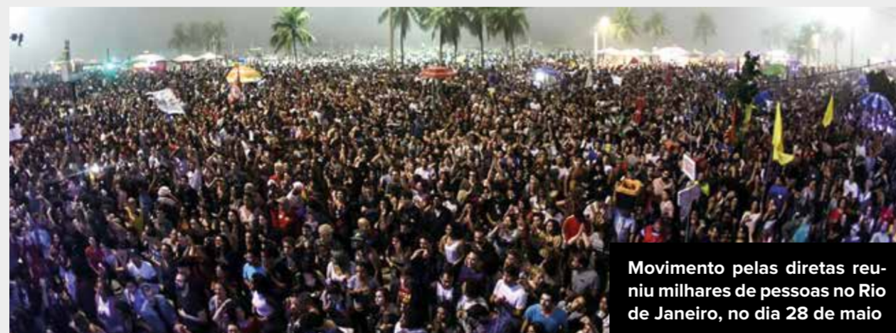
Movimento pelas diretas reuniu milhares de pessoas no Rio de Janeiro, no dia 28 de maio

Diretas já tem apoio de 90% dos brasileiros