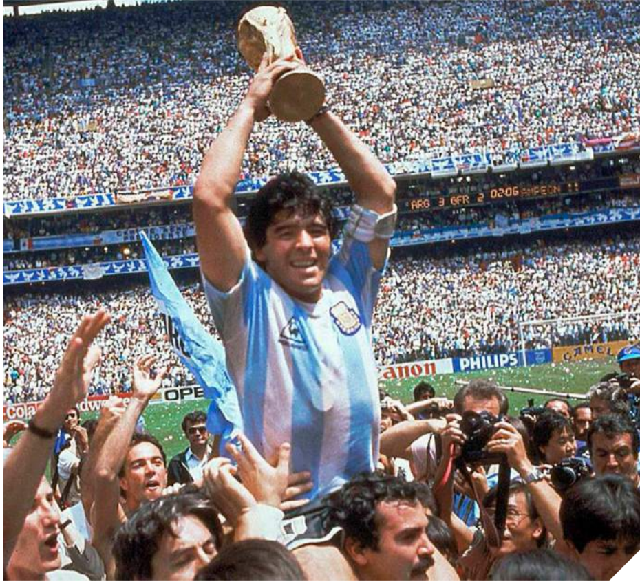
Maradona ergue a taça do Mundial de 86. Conquista foi dedicada à classe trabalhadora argentina

No último dia 25 de novembro o mundo do esporte recebeu com grande tristeza a morte de Diego Armando Maradona, aos 60 anos, devido a uma parada cardiorrespiratória. Um dos maiores jogadores de futebol de todos os tempos. Sua perda fez o governo argentino decretar 3 dias de luto. Dieguito, como era chamado, esbanjava técnica nos gramados, na Argentina, na Europa e principalmente no mundial de 86, quando ergueu a taça pela seleção de seu país. Mas, além do talento nas quatro linhas Maradona também era um craque na luta por uma sociedade mais justa e solidária. Ele sempre defendeu causas sociais progressistas, entre elas o imposto sobre grandes fortunas. Ao vencer a Copa de 86 Maradona dedicou a vitória à classe trabalhadora. Ele também manteve distância dos militares na Argentina. Estes usavam o futebol como plataforma para disseminar as ideias do regime que por sete anos violou direitos humanos no país.